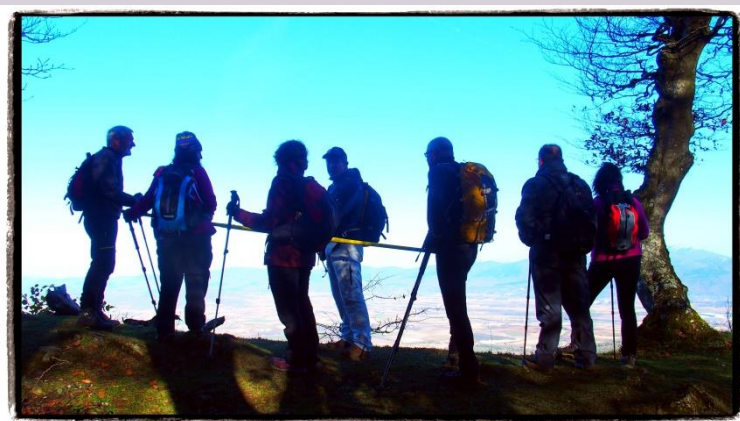
Texto y fotografía: Jesús M o Escarza Somovilla

Y al fin, que toda la comitiva paladeó a fondo esa jornada de monte, que todo salió a pedir de boca y que quedamos con ganas de vernos otra vez, cuanto antes, donde sea... pero que haya una Naturaleza, al menos, tan hermosa como la de hoy.